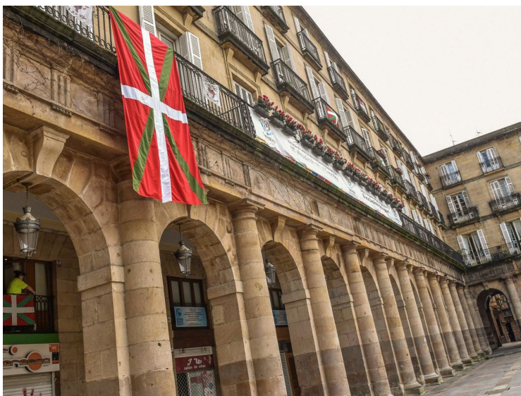
Imagen de una ikurriña en el Aberri Eguna.

Los regímenes forales están amparados por la Carta Magna, pero ésta no determina que no tengan que participar en la nivelación territorial. De hecho, esto podría ir en contra del principio de solidaridad